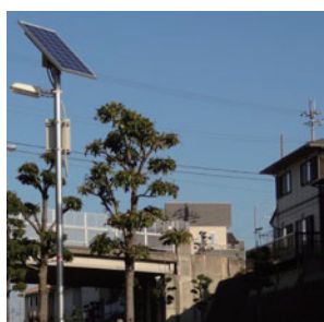
香芝旭ヶ丘ニュータウン