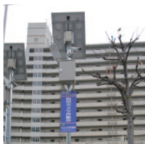
大阪市喜連東連合振興町会