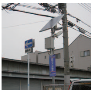
大阪市加美北連合町会