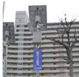
大阪市喜連東連合振興町会