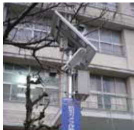
大阪市長吉六反連合町会