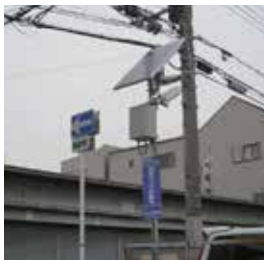
大阪市加美北連合町会