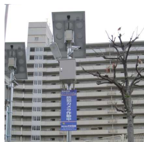
大阪市喜連東連合振興町会