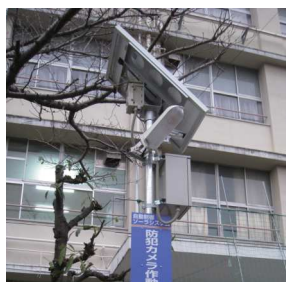
大阪市長吉六反連合町会