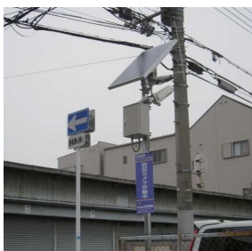
大阪市加美北連合町会